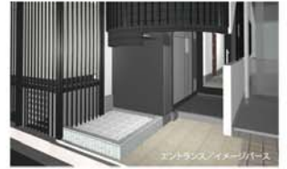
※エントランスには、オートロックを採用。